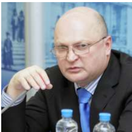
Руководитель Аппарата Подкомитета ТПП РФ по лизингу Директор НП «ЛИЗИНГОВЫЙ СОЮЗ»