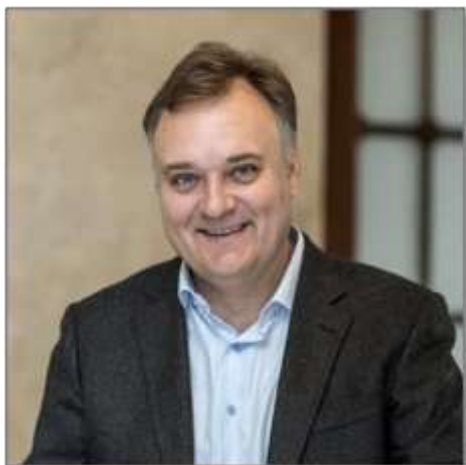
Председатель Подкомитета ТПП РФ по лизингу Председатель Совета НП «ЛИЗИНГОВЫЙ СОЮЗ»