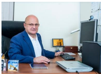
Председатель Подкомитета ТПП РФ по лизингу Директор НП «ЛИЗИНГОВЫЙ СОЮЗ»