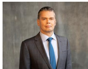
Председатель Совета НП «ЛИЗИНГОВЫЙ СОЮЗ», Генеральный директор ГК ВТБ Лизинг

Вклад Подкомитета и Партнерства в развитие лизинговой индустрии отмечается операторами лизингового рынка и органами